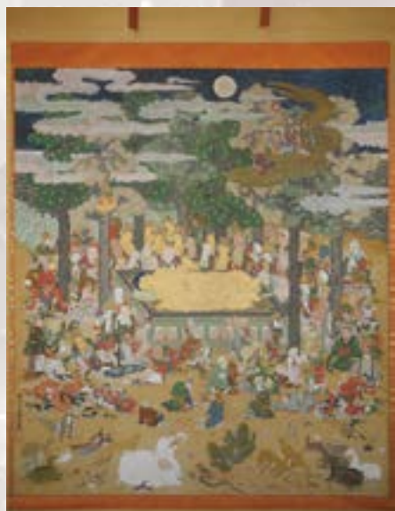
▲高龍寺所蔵の涅槃図

余談ですが、涅槃図を拝んだことがあるかないかで閻魔様からの評価も変わるそうです。 コロナウイルスの流行で、おいでいただくのが難しい方もいらっしゃるかと思います。機会があればぜひ涅槃会にお参りいただき、当寺の涅槃図もご覧いただければ幸いです。