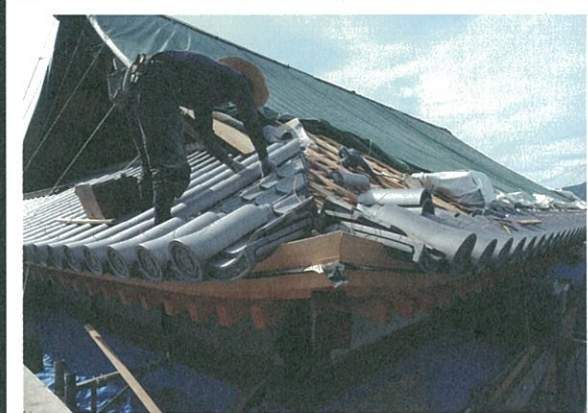
連日猛暑の中の工事の様子