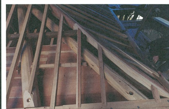
屋根の隅木を補強する為に今回隅木を4隅に2本ずつ増やしました

屋根工事終了後、客殿の玄関と廊下、その後、本堂への渡り廊下、最後に本堂縁側工事を行い、平成29年早春完工の予定です。