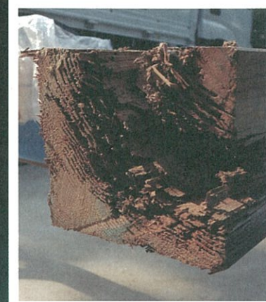
シロアリによる柱の腐食が数本ありましたので、柱の入れ替えをしました