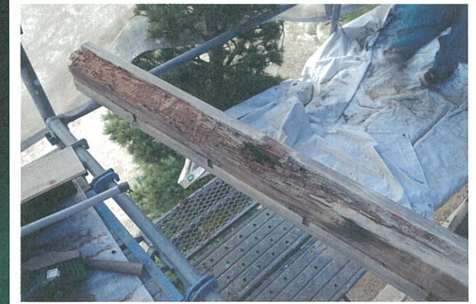
腐食した屋根の部材