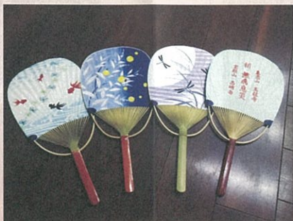
▲「無象息災」の団扇をお配りしています。